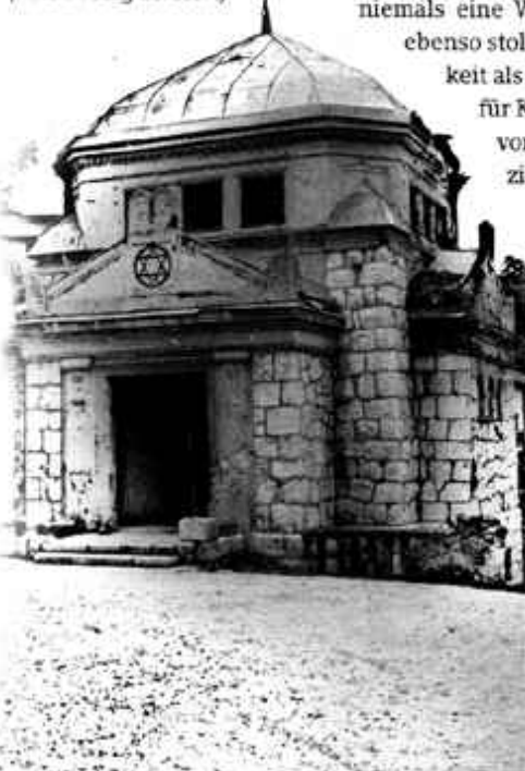
Synagoge (innen völlig zerstört)