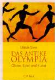
Ulrich Sinn Das antike Olympia Götter, Spiel und Kunst

[Thorbecke, Ostfildern 2004, 208 S., 400 Abb., € 29,90]