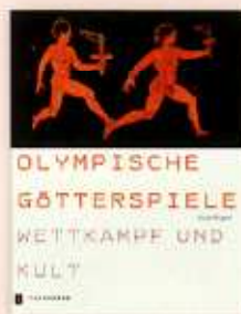
Ulrich Wegner Olympische Götterspiele Wettkampf und Kult

[Thorbecke, Ostfildern 2004, 208 S., 400 Abb., € 29,90]