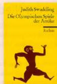
Judith Swaddling Die Olympischen Spiele der Antike

[Primus, Darmstadt 2004, 176 S., 35 Abb., € 19,90]